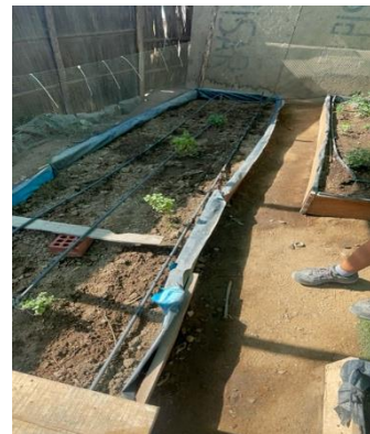
Foto:..El biohuerto es una herramienta importante para la alimentación saludable, se utiliza un método agroecológico

“...Aquí tú ves cómo crecen nuestros propios frutos, y tú mismo lo estás viendo: están libre de insecticidas”, ...”