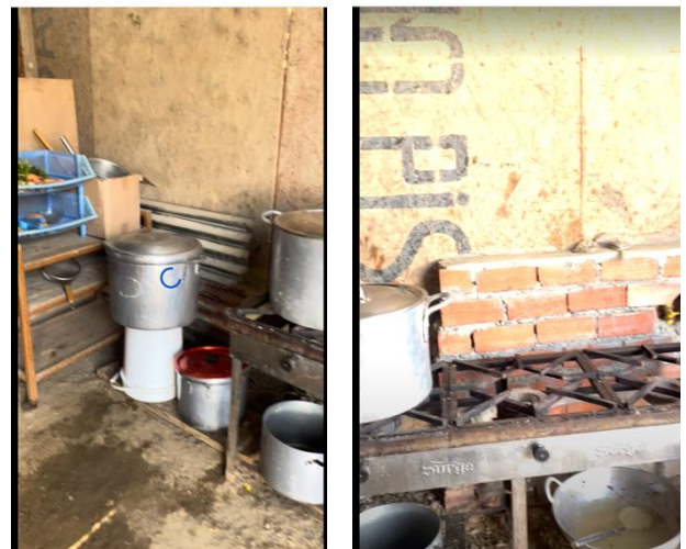
Foto: El menú se organiza en asambleas y se mantiene a un precio accesible..

En 2023, con el impulso de su comunidad y su propio entusiasmo, fundó la olla común "Miski - La Meseta". Desde entonces, ha dedicado un área de 70 metros cuadrados de su hogar para la preparación de alimentos, ofreciendo un espacio de solidaridad.