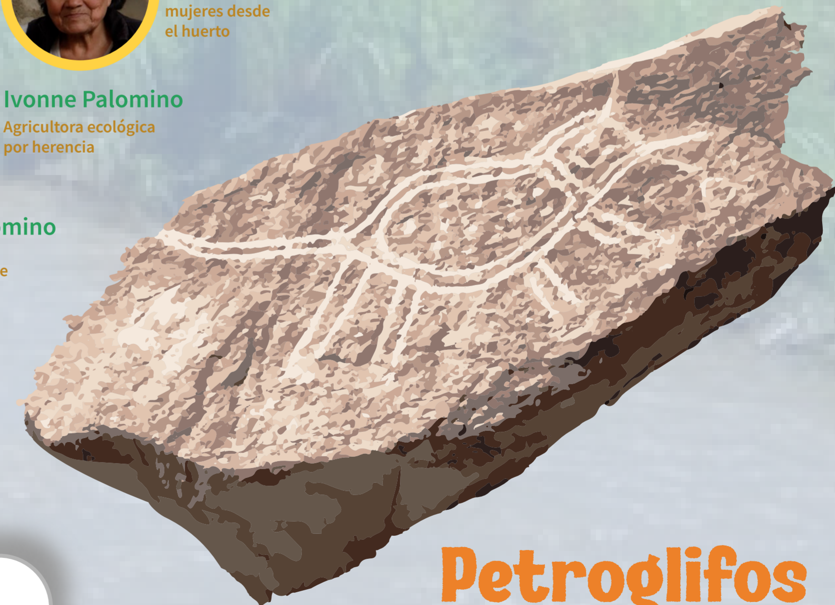
Petroglifos de Checta